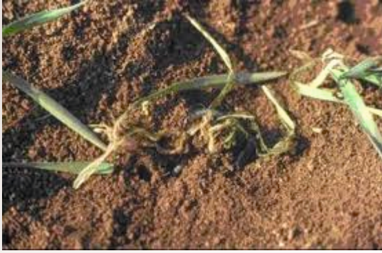
Ekin kambur böceği larvaları ve zararı