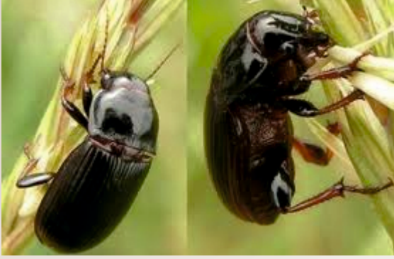
Eki Kambur Böceği ergini

12-22 mm boyunda ve 5-8 mm eninde parlak siyah renklidir.Zararlı yılda bir döl verir.Buğday, arpa,çavdar,yulaf konukçu bitkileridir.