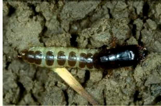
Ekin Kambur Böceği larvası

Verimin önemli ölçüde azalmasına neden olur.Hasada yakın günlerde başak danelerini, ekimde ise toprak altındaki daneleri kemirerek zararlı olurlar.